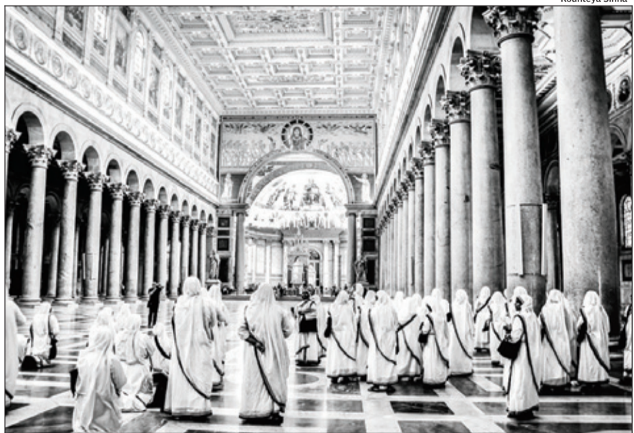
HISTORY IN THE MAKING: Nuns of Missionaries of Charity on a tour of Basilica of Sao Paolo in Rome

Vatican City: A public mass by Pope Francis and a special papal audience at the iconic St Peter's Square, family feasts hosted by the nuns of Missionaries of Charity (MOC), musicals, exhibitions and release of a commemorative stamp will mark the canonization of Mother Teresa as a saint here on September 4.