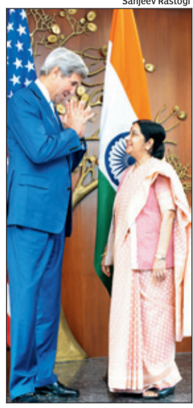
Union minister Sushma Swaraj and US Secretary of State John Kerry interact prior to a meeting in Delhi on Tuesday

"We reaffirmed the urgent necessity for Pakistan to dismantle safe havens for terrorists and criminal networks including Lashkar-e-Taiba, Jaish-e-Mohammed and D-Company," Swaraj said after the conclusion of the last strategic and commercial dialogue with the Obama administration. On his part, Kerry said,