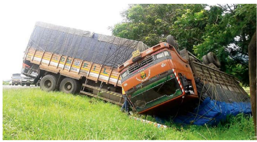
एक्सप्रेस-वेवर झालेल्या अपघातात दोन टेम्पोंची आशी अवस्था झाली.