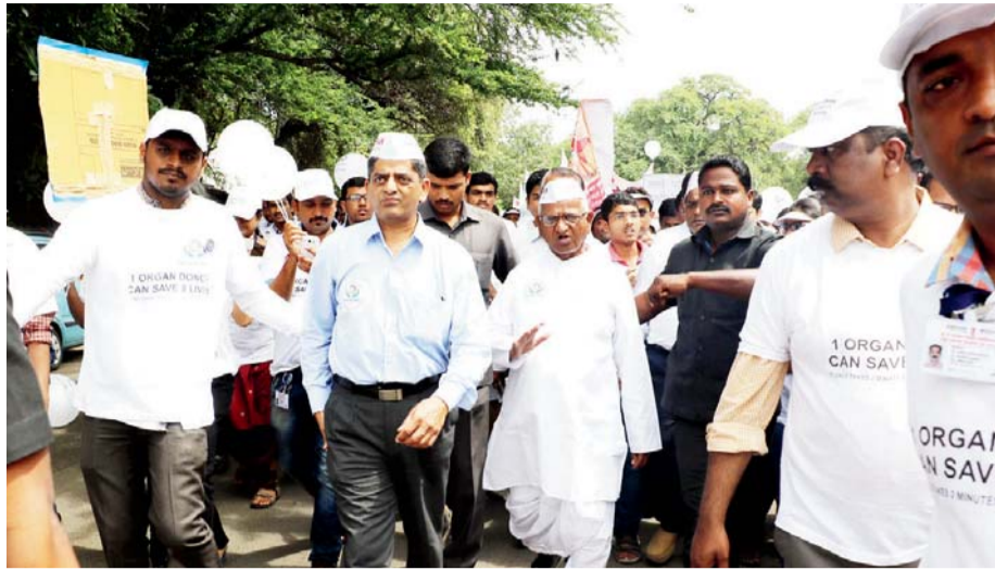
अवयवदान चळवळीच्या जनजागृतीसाठी बी. जे. वैद्यकीय महाविद्यालयाने काढलेल्या रॅलीचे नेतृत्व ज्येष्ठ समाजसेवक अण्णा हजारे यांनी केले.