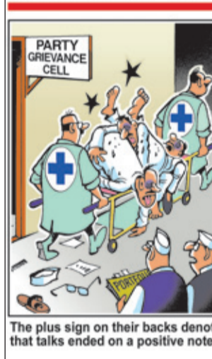
The plus sign on their backs denote that talks ended on a positive note.